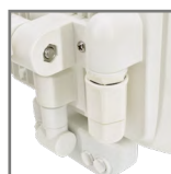
dwie wersje kolorystyczne obudowy