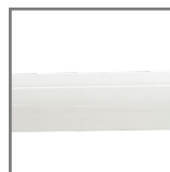
szkło w kolorze mlecznym