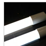
diody LED o zwiększonej wydajności